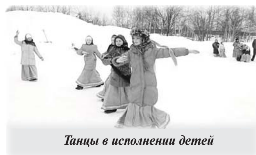
Танцы в исполнении детей