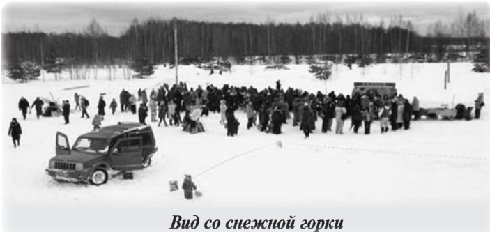
Вид со снежной горки

сказать, что блины были абсолютно бесплатные, так же как и чай, мёд и прочие вкусности - всё было ДАРОМ!