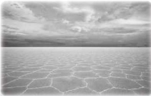
Боливия выходит на передний край борьбы с изменениями климата.