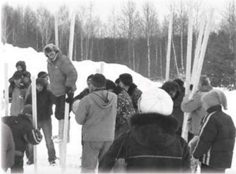
Ходьба на ходулях

пление весны, а женщины - зиму, которая не хочет сдавать своих позиций. Естественно, как и должно быть, победила весна.