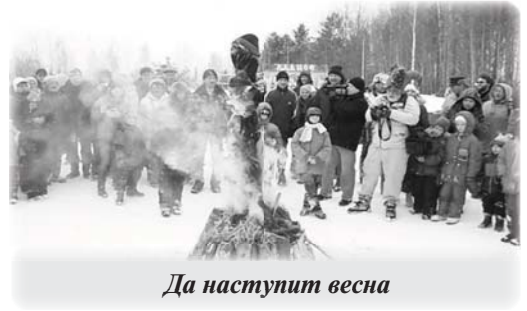
Да наступит весна

Все желающие повязали на чучело повязки, ленточки, с пожеланиями освободиться от всего негативного, что накопилось за зиму. А один из участников, водрузил на чучело свою шапку, со словами: «Новая жизнь начинается!». И чучело было зажжено. Когда оно горело, люди кричали похвалы уходящей зиме и приветствовали добрыми словами приход весны.