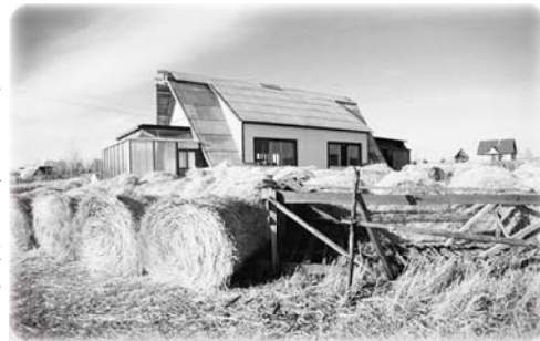
Сено — не для коров. Для утепления стен