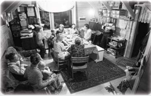
В тереме — субботние посиделки