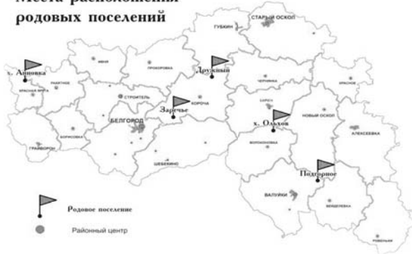
Места расположения родовых поселений

ОАО «Белгородская ипотечная корпорация» начала выдачу земельных участков для создания родовых усадеб. Расположены будущие родовые поселения на территории четырёх районов Белгородской области: Валуйского, Волоконовского, Корочанского и Краснояружского. На данный момент запланировано создание пяти таких поселений: на хуторах Анновка и Ольхов, а также в посёлках Дружный, Заречье и Подгорное.