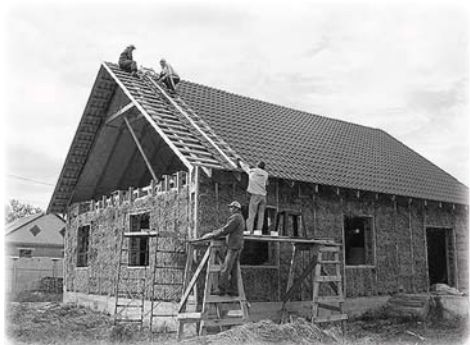
Такое жилье даже пенсионеру по карману.

что коровы, - грызуны не страшны. Ржаную солому давно не используют в кормовых целях — в её составе много песка. Мыши и крысы её тоже не любят. Но на всякий случай стены от вредителей защищают металлической сеткой.