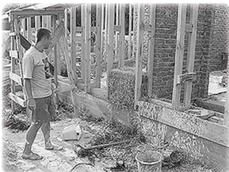
Возведение стен — процесс нетрудоемкий.

Он дешевле обычного, экологически чистый, тёплый и биопозитивный.