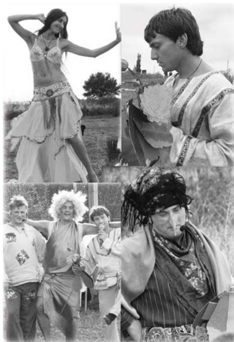
Постановка сказки «Как Иван-Царевич за счастьем ходил»

В стадии разработки находятся ещё несколько проектов: планируется эксперимент по созданию установок для производства биогаза и других источников энергии, разрабатывается проект по посадке садов на территории поселения, на 10 гектарах земли ведётся