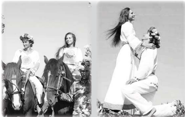
Венчание в Синегорье

О воде тоже выспрашивали у местных. Оказалось, что множество родников било когда-то на землях поселения. Но постепенно одни пересохли, другие завалило оползнями. Стали поселенцы родники искать, да приглашать лозоходцев. А меж тем отсутствие достаточного количества воды тоже привело к своим результатам. Многие поселенцы научились выращивать некоторые