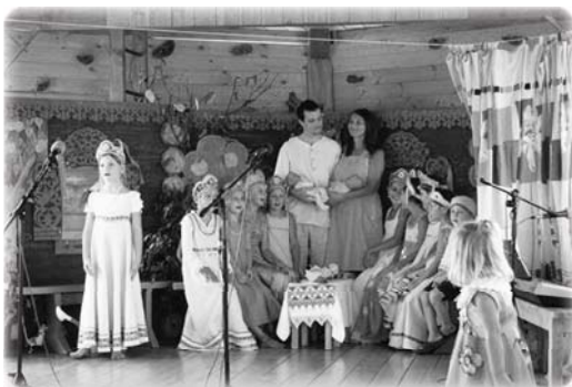
Детский ансамбль «Лебёдушки»