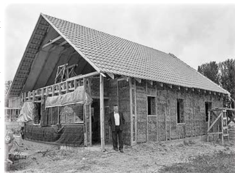
Хозяин дома построил не один дом для детей, но для себя выбрал именно соломенный.

Есть ещё одна немаловажная деталь — экология. Такой дом совершенно безвреден для человека и окружающей среды. И пока полтавчане только готовятся к новоселью, белорусы и россияне,