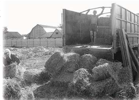
Жители села с большим интересом относились к строительству, на которое вместо стройматериалов привозили солому.

Дом из соломы построили в США ещё в 1896 году. Это была школа. Но прослужила она недолго. Соломенная постройка пришлась по вкусу коровам! Современным домикам не то