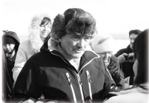
Владимир Мегре в поселении Алмарай

20 января 2012 г. в г. Алматы состоялась читательская конференция с писателем, автором книг серии «Звенящие кедры России» Владимиром Мегре.