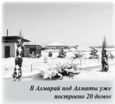
В Алматы под Алматы уже построено 20 домов

Есть поселение Родная земля и близ Павлодара, где осваивается более 10 участков.