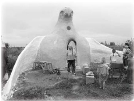
Хозяйка поместья с баней — Турсунбаева Нурипа