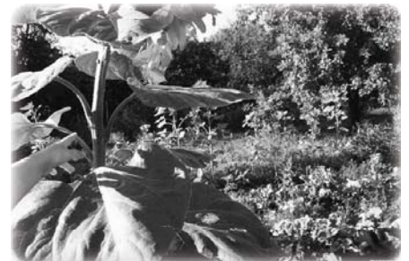
Она ростом невеличка, личиком круглолиčka.