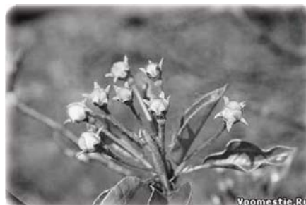
Грушка зацветает, весна 2010