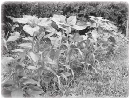
Подсолнечник и кукуруза, 2009. Вся органика идёт на компостную кучу, а потом на грядки круглолиčka.