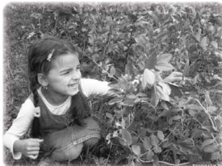
Горох и боб, 2009. Каждое растение мульчируется сеном несколько раз в год. Укрытие глушит сорняки, конденсирует росу, сохраняет влагу, оберегает почву от солнышка