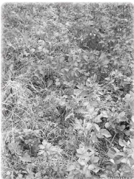
Картофель, 2009. Разложили на траву, сверху завалили сеном