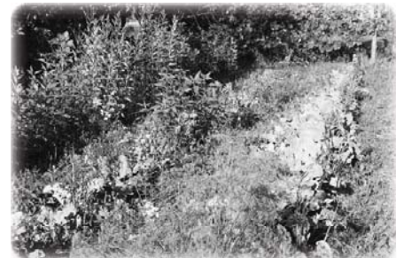
Капуста. Широкие междурядья подкашиваются косой или серпом