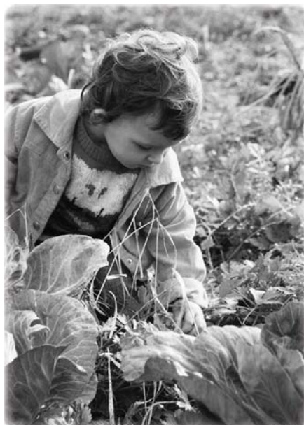
Капуста осенняя, ноябрь 2010