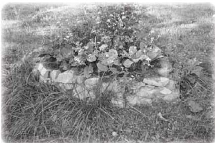
Гречиха. Ограждение - камень, всередине перегной