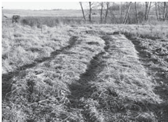
Фото. Замульчированные грядки, в таком виде уходят в зиму. Севооборот. Каждый сезон меняем

Используем растения-сидераты. Сидераты — быстрорастущие растения с развитой корневой системой. Применяем для структурирования, глубокого рыхления почвы. Некоторые из них обогащают почву полезными веществами (бобовые). Ботва сидератов заделывается в почву как удобрение или идёт на мульчу. Например, моя мама, с восторгом рассказывает о своём опыте высаживания горчицы (сидерат) в саду сразу после сбора урожая. Говорит, что весной на этих грядках, даже без перекопки, удивительно рыхлая и плодородная земля.