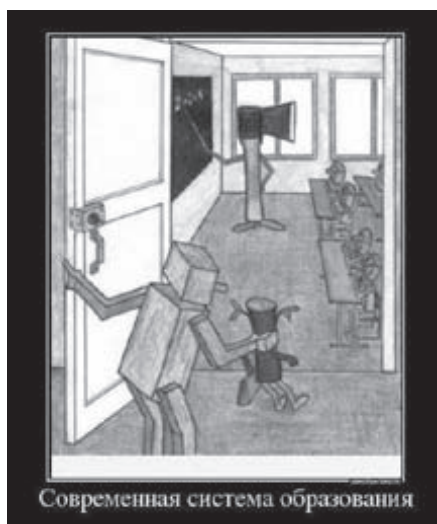
Современная система образования

Я просто не понимаю, как эти люди собрались учить моего ребёнка и что они могут ему дать?! С воспитательницей нам очень повезло. Но везение состоит в том, что свой выбор дошкольного учреждения мы сделали, основываясь на том, какой у ребёнка будет воспитатель, а не на красоте помещения и крутости игрушек. К вопросу первого учителя мы подойдём ещё более серьёзно. Хотя мысли о домашнем образовании стали всё чаще посещать мою и так уже замороженную всеми этими «праздниками-фестивалями-надо-чтобы-у-ребёнка-была-белая-рубашка-и-чёрные-