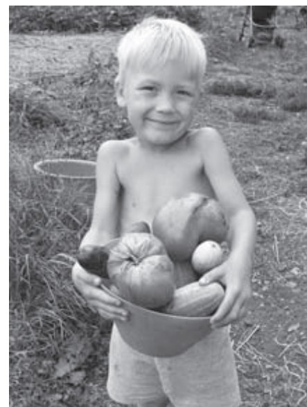
Фото. Сын демонстрирует летний урожай.

В нашем ежедневном рационе теперь блюда из своих овощей! Получаем огромное удовольствие от даров земли. И самое главное, что работа идёт на будущее, ведь почва становится всё более плодородной, и готовой давать высокие урожаи.