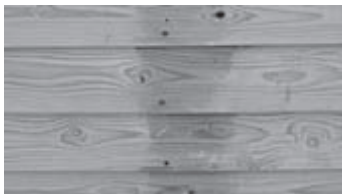
Фото: серая полоса от строительных лесов так и осталась не покрашенной, как иллюстрация разницы. Это самая нижняя часть северной стены (наиболее намокающая и медленнее просыхающая).

В целом — результат хороший. Дом выглядит удовлетворительно. Летом 2014 г. хочу перекрасить составом с льняным маслом.