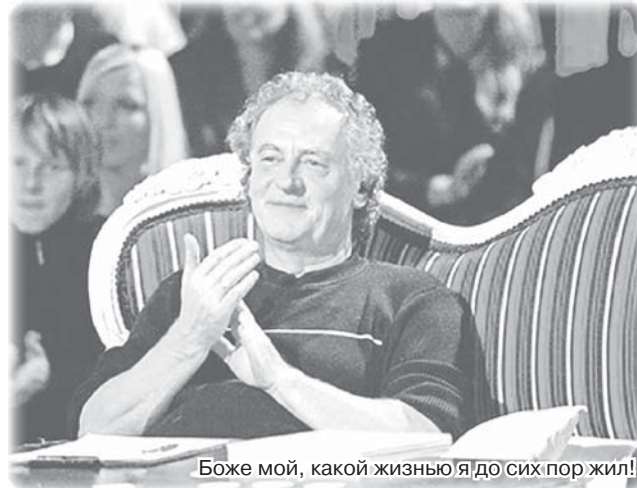
Боже мой, какой жизнью я до сих пор жил!

самой большой ценностью, утеряно, его у него отобрали! Таллинн уже давно не принадлежит таллиннцам. Я