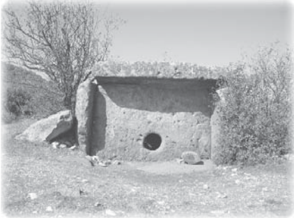
Продолжение. Начало в газете «Быть добру» №5(29), 2008 г.