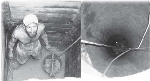
Чистка колодцев. Веселое занятие!)

Наличие воды, качество воды (наберите на анализ) и количество (сколько можно выкачать, если качать непрерывно, как быстро наберётся). Ответ продавцов «у нас хороший колодец» ни о чём не говорит. Проверьте, может колодец требует ремонта. Стоимость ремонта от 1500 гр. (почистить) до 10000-15000 гр. выкопать новый. Иногда старые колодцы отказываются чистить. Лучше перед покупкой узнать у местных специалистов, во сколько обойдётся ремонт. Бывают колодцы с земляной шахтой почти без колец. Чистить колодец своими силами не рекомендую, мероприятие не для слаборервных.