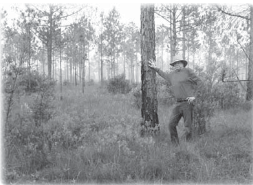
лет он полностью восстановил всю