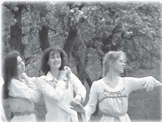
Семейный хоровод влюблённых сердец кадр из фильма «В лучах праздника-2»

Я с радостью хочу сообщить Вам, что вышли в свет уже два фильма серии «В лучах праздника»! Во время просмотра фильмов вы прочувствуете всю радость и многообразие настоящего народного гуляния с его много-