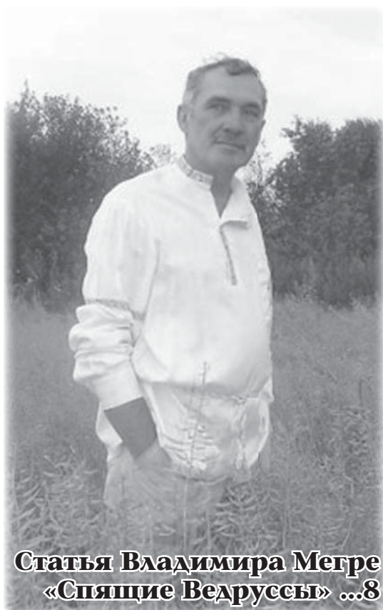
Статья Владимира Мегре «Спящие Ведруссы» ...8

Обращение к депутатам, олигархам, президентам ...2