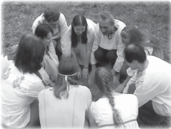
Обрядовый хоровод «Веснянка» (театр-студия «Родник») кадр из фильма «В лучах праздника-2»