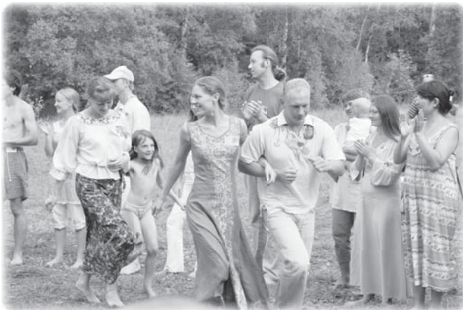
Брачный слет в пос. Родовое, Тульской обл. (авг.2007г.) кадр из фильма «В лучах праздника-2»

Это — Любовь. Любви в семьях не хватает, её надо возрождать. Любовь к Родине, к людям, просто какая-то доброжелательность и доверие к окружающим. Много! Целый спектр всего хорошего как раз вот в таких народных хороводах, танцах возрождается. Тут нет места плохим чувствам. И даже если ты придёшь на такой хоровод с ними, они просто исчезнут!»