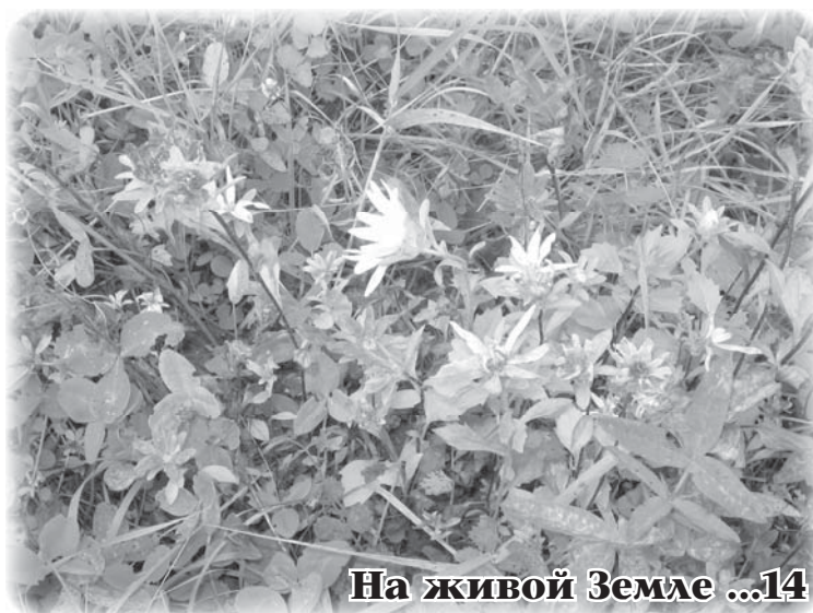
На живой Земле ...14

Сейчас мы стали многое в жизни осознавать. Что земля – живая, как деревья, травы, животные, как люди. На живой Земле с Божественной Природой жить интересно.