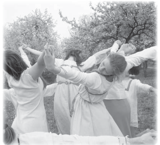
Семейный хоровод (театр-студия «Родник») кадр из фильма «В лучах праздника-2»

Такими словами начинается «Семейный хоровод влюблённых сердец», который представлен во второй серии фильма. Глубину образов, заложенных в каждом движении хоровода, помогает раскрыть текст, звучащий за кадром. Звуки чарующей музыки, прекрасные движения танца, весна в цветущем яблоневом саду, счастливые семейные пары, нарядно одетые в праздничные одежды, - все это создает удивительную атмосферу и приоткрывает суть и смысл древних Ведических хороводов.