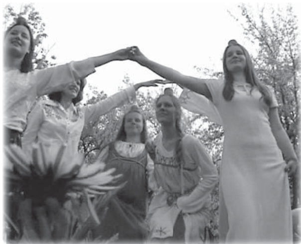
Конкурс «Танец с яблоками» («В лучах праздника-1»)

истинному «я». Человек погружается в события, происходящие «здесь и сейчас», запоминает эти ощущения и уносит это состояние в свою повседневную жизнь.