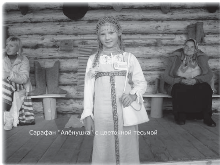
Сарафан "Алёнушка" с цветочной тесьмой

системы. А стоит только задуматься и не идти на поводу у заманчивой красавицы. Вспомните, как одевались наши прадедушки. Ткань пряли из хлопка, льна, крапивы, конопля, плели шерстяные изделия, те же валенки из шерсти, шили пуховики на зиму. Если мысль так изворотлива на ложную красоту, то она способна творить чудеса, направленные на благо человека! Здорово, что сейчас стали входить в моду натуральные ткани. Даже мятая, трудновыглаживаемая вещь из льна и хлопка стала модной. Валенки в России