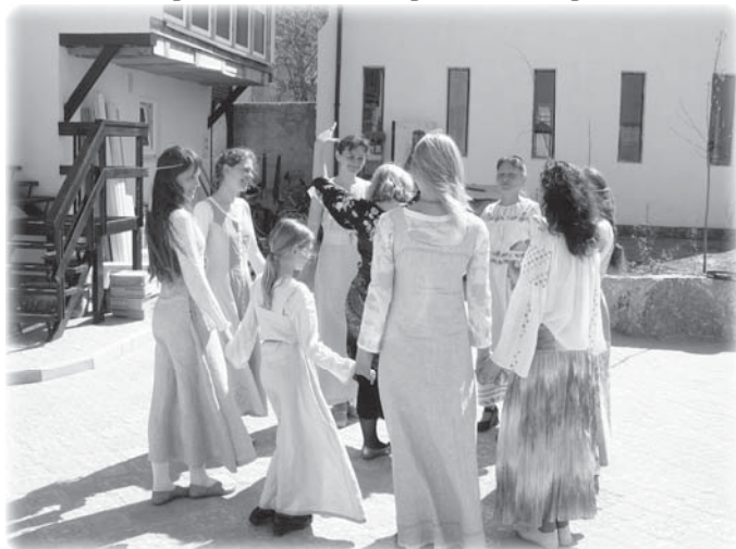
1-я Академия народного праздника (Крым, апр.2007г.) кадр из фильма «В лучах праздника-2»

туальное, и физическое. Надо быстро двигаться, быстро мыслить. Такое впечатление, что это новое направление хорошо забытого старого. И вот такое возрождение очень прият-