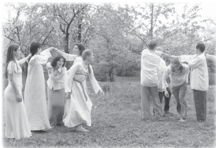
Семейный хоровод (театр-студия «Родник») кадр из фильма «В лучах праздника-2»

ное, интересное. Причём где-то внутри такая вспышка интереса, вспышка радости оттого, что ты делаешь. Никого не опережаешь, а играешь! Независимо от возраста, независимо от того кто присутствует: старые, маленькие, средний возраст...».