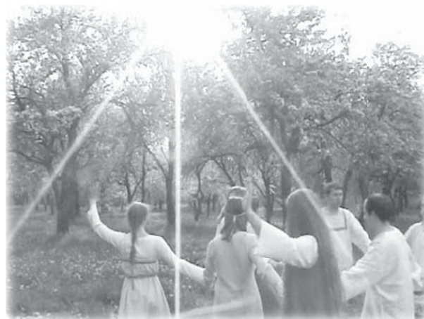
Обрядовый хоровод «Веснянка» (театр-студия «Родник») кадр из фильма «В лучах праздника-2»