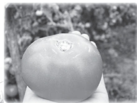
Помидор на биогумусе

огурцы, капуста, кабачки, перцы, тыква зелень, картошка и т.д.), а на второе место ставим для себя создание условий для успешного выращивания многолетников (ягода и фрукты, орехи). Овощами мы смогли себя обеспечить полностью сразу же в первый год благодаря налаживанию цикла получения биогумуса при разведении красного калифорнийского червя. Это был второй год освоения нашего участка.