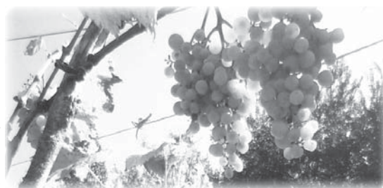
Виноград «Юбилей Херсонских дачников»

Виноград нужно уметь грамотно формировать и обрезать (научились это делать - хорошо полно виноградников вокруг). Теперь мы и виноградом лакомимся!