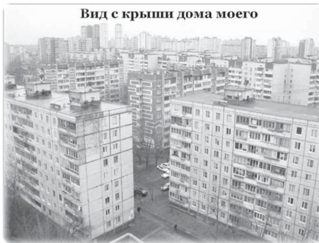
Вид с крыши дома моего

По официальным социологическим опросам - 60% жителей России мечтают о собственном доме. Не о квартире в многоэтажке, но о полно-