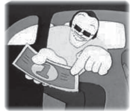
Вступать в половые связи со взрослыми