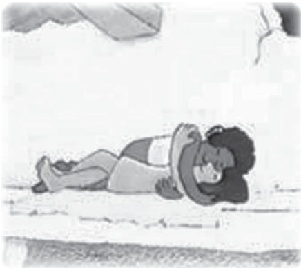
Вступать в ранние половые связи