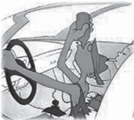
Пить за рулём