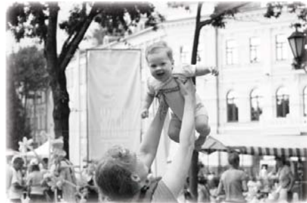
Фото: пять месяцев спустя.

Я желаю всем вам, милые, кто читает эту статью, лёгких и счастливых родов!