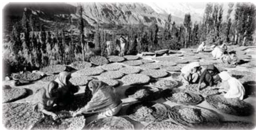
Фото: сбор урожая. Долина в Гималаях

На севере Индии, в труднодоступной гималайской долине живёт племя Хунза. Люди племени не знают, что такое болезни, а средняя продолжительность жизни - 110–120 лет.