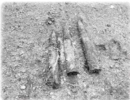
Крымские бактерии поедают взрывчатку.

Группа учёных Севастопольского института ядерной энергетики (до 1992 года — Севастопольское высшее военно-морское училище по подготовке специалистов-ядерщиков) разработала уникальную технологию переработки взрывчатых веществ в органическое удобрение, сообщил РИА Новости в четверг научный сотрудник