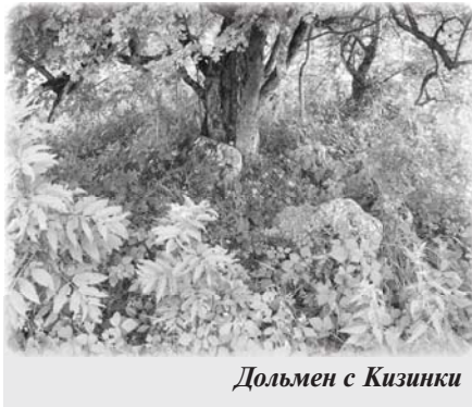
Дольмен с Кизинки

доме. Поступим так. Я расскажу тебе свой замысел о доме, а ты, что нужно, подправляй. Ты можешь откровенно говорить, о том что нравится тебе иль нет, я не обижусь за критику твою. Мне интересно очень твоё мнение.