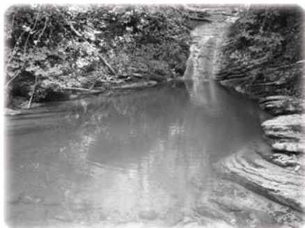
Окончание. Начало в газете «Быть добру» №1(85) 2013 г.

Дольмен Вечеслав (вечность славить, молодой мужчина)