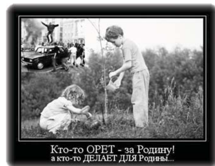
Кто-то ОРЕТ - за Родину! а кто-то ДЕЛАЕТ ДЛЯ Родины...