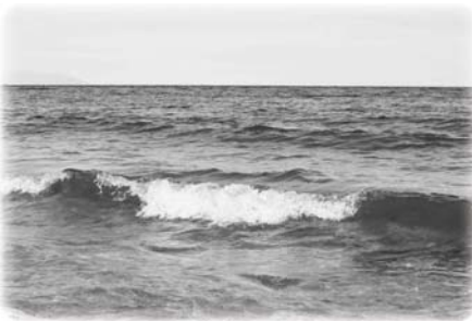
В благодарность Д.Р. Кипплингу...