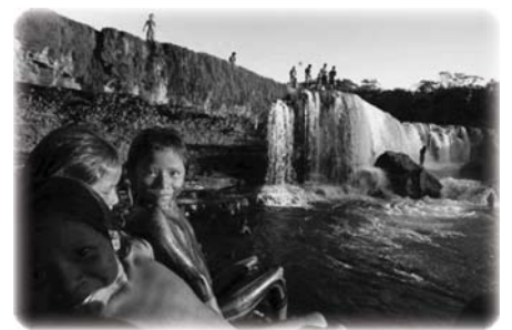
ций на всем протяжении Амазонки.

В конце 1980-х индейцам каяпо уже удалось убедить правительство Бразилии отказаться от строительства шести крупных гидроэлектростанций на этом притоке Амазонки. В связи с повышенным вниманием к вопросам экологии Всемирный банк тогда прекратил финансирование строительства каких-либо гидроэлектростан-