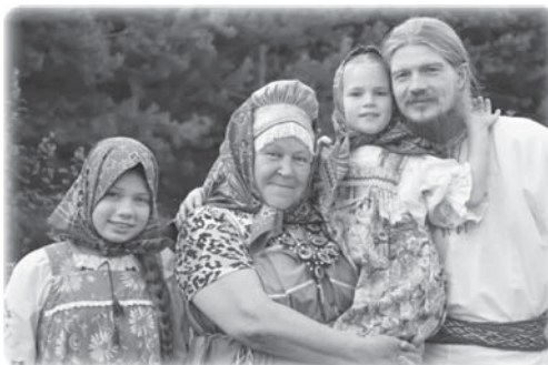
— три, четыре яблоньки, пару слив,

Порой этот вопрос (с перчинкой) возникает на просторах интернета. Имея за плечами опыт проживания в дачном посёлке и в родовом поселении, могу коротко сформулировать их основные отличия. Первое — это размер участка, в нашем поселении это до трёх и даже 8 га. Соответственно появляется возможность иметь лошадей, коз, коров (не на убой), закладывать настоящие сады, а не как на дачах