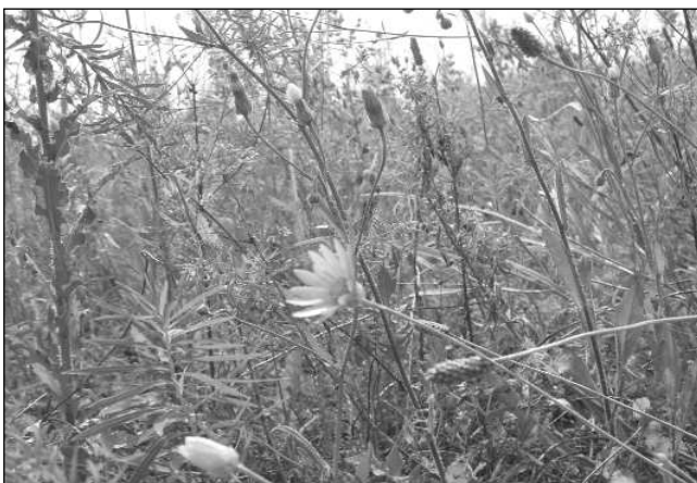
Народные методы борьбы с вредителями стр. 10

Брачный слёт (со 2 по 10 сентября в 2006 г. под Киевом) стр. 6