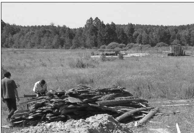
Письма читателей. Реализация идей, описанных в книгах В. Мегре стр. 14

Новые технологии. Бензин из розетки стр. 15