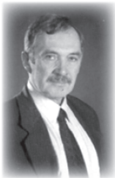
Статьи В. Мезре: «Народный суд», «Исковое заявление» стр. 8