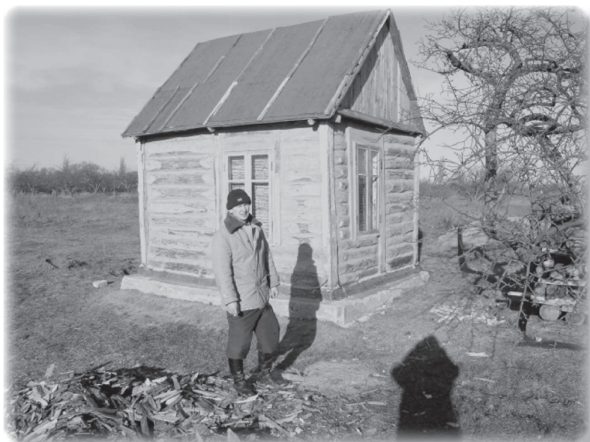
Жизнь поселенца стр. 3

ОТКРЫТОЕ ОБРАЩЕНИЕ МАЙИ (ИСП. ДИРЕКТОР ВЛАДИМИРСКОГО ФОНДА) ...12