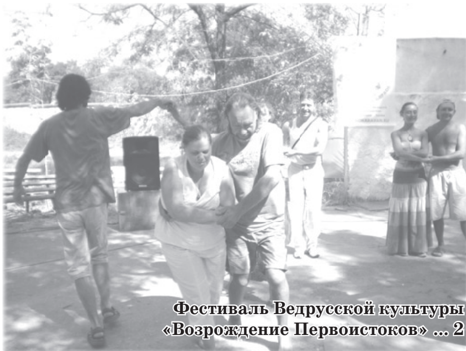
Фестиваль Ведрусской культуры «Возрождение Первоисточков» ... 2